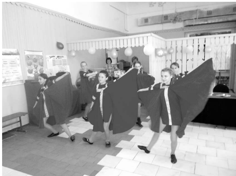
Детский танцевальный ансамбль.